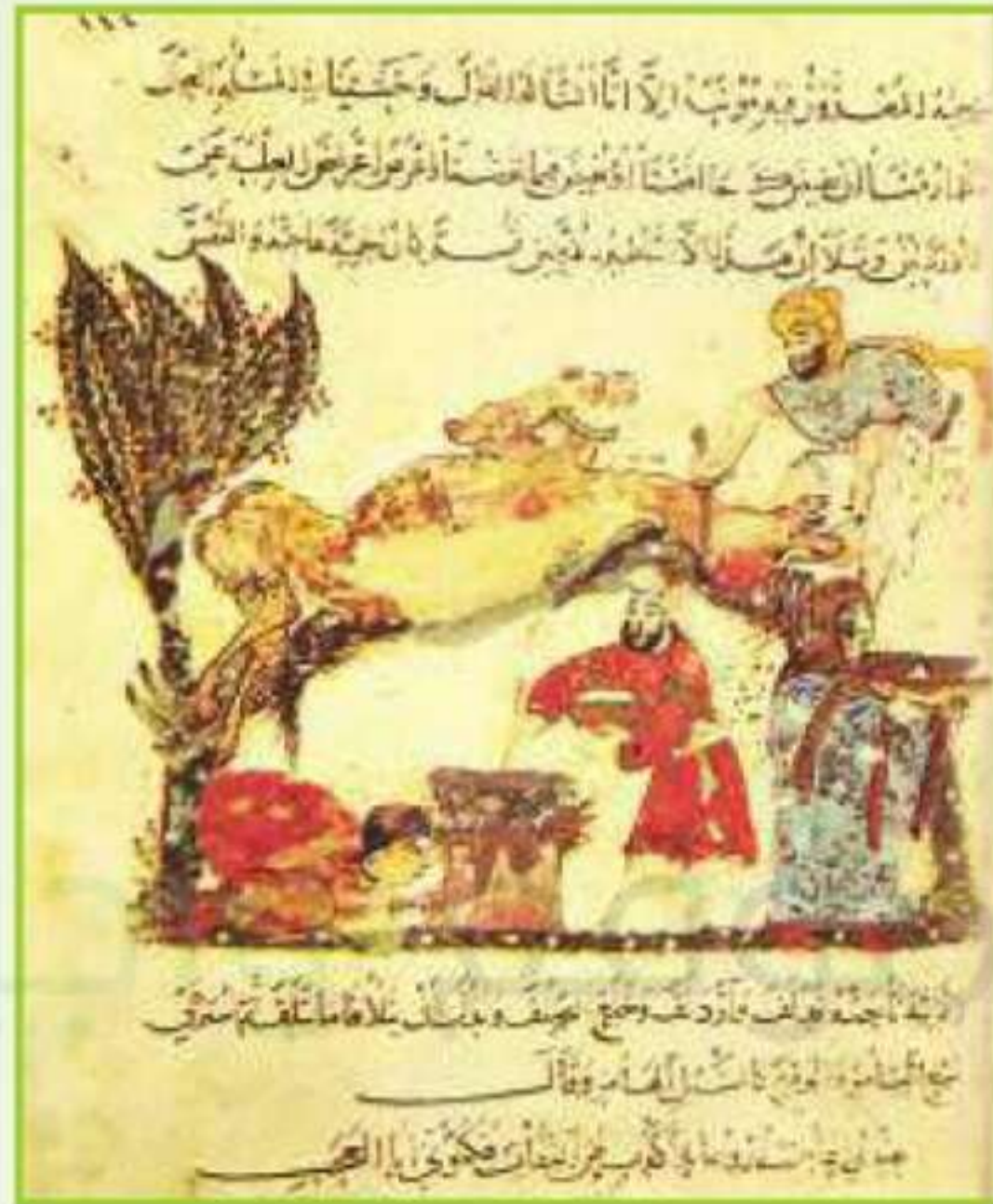
الشكل (٢): لوحة منمنمة

في السطور الآتية اكتب وصفاً لما تراه في المنمنمة ابتداءً بالموضوع، ثم بالعناصر الشكلية من لون وخط وشكل وزخارف.