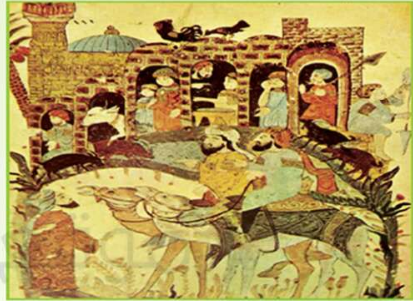
الشكل (١)، لوحة للفنان يحيى الواسطي

يحيى بن محمود الواسطي: (من القرن الثالث عشر ميلادي) رسام عربي ولد في بلدة واسط في جنوب العراق بداية القرن الثالث عشر الميلادي. اختط نسخته عام ١٢٣٧م، من مقامات الحريري وزينها بمائة منمنمة من رسومه تعبر عن الخمسين مقامة (قصة). وكان عمله هذا أول عمل في التصوير العربي نعرف اسم مبدعه. كمال الدين بهزاد: (نحو ٨٥٤- نحو ٩٤١ هـ / نحو ١٤٥٠- نحو ١٥٣٥م) هو مصور منمنمات، من أهل هراة في إيران طور فن المنمنمات في المخطوطات الإيرانية وله ثلاث منمنمات وبرع في تصوير الخيول وانتشرت شهرته إلى بلاد فارس ولا يعرف تاريخ وفاته.